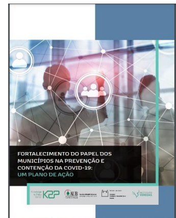
Figure 3 : Produit factuel coproduit et adapté au contexte brésilien

Un récent article de revue a exploré l'expérience de K2P dans la création de la série d'interventions rapides contre la COVID-19 ; un autre article de revue a discuté de l'initiative avec des efforts similaires en Allemagne, à Hong Kong et au Pakistan.