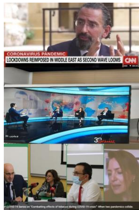
Figure 2 : Les parties prenantes communiquent des orientations fondées sur des données probantes sur les chaînes d'information

Alors que les autorités libanaises envisageaient de mettre fin aux mesures de confinement fin avril 2020, K2P a publié un autre document de réponse rapide qui synthétisait les données disponibles et les expériences nationales relatives à l'assouplissement des mesures de confinement tout en préservant la santé publique et en répondant à la crise économique et sociale qui s'aggrave. En septembre 2020, K2P a publié une série de trois documents portant sur les caractéristiques cliniques et la transmission de la COVID-19 chez les enfants , l'impact de la fermeture des écoles et les stratégies pour rouvrir les établissements d'enseignement en toute sécurité . Fin 2020 et début 2021, alors que les premiers vaccins contre la COVID-19 susceptibles de prévenir les cas graves de la