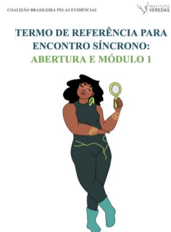
Curso Introdutório sobre Tradução do conhecimento e Políticas Informadas por Evidências (PIE) para Equidade: encontrar e usar evidências científicas para informar a tomada de decisão em intervenções sociais

La deuxième édition était le premier cours brésilien axé sur l'équité dans le domaine de l'EIP et sur la lutte contre la sous-représentation sexuelle et raciale. Il reste encore beaucoup à apprendre sur la manière de continuer à promouvoir l'intérêt pour l'EIP et d'améliorer l'accès à ce type de formation, mais il s'agit