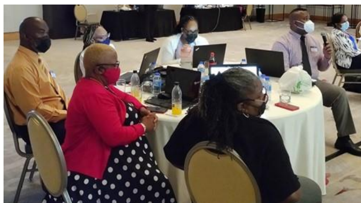
Figure 2 : Des représentants du ministère des Sports et du Développement communautaire participent à l'atelier de renforcement des capacités en matière d'EIP

L'équipe du CCHSRD et Sandy ont appris les uns des autres en partageant leurs expériences par courrier électronique et par appels vidéo. L'équipe a rédigé des documents sur l'évaluation des besoins, la définition des priorités, l'animation d'ateliers et l'accompagnement, puis en a discuté avec Sandy. Si les documents relatifs aux données de la recherche étaient techniquement solides, les chercheurs en début de carrière qui les ont élaborés avaient besoin d'aide pour adopter le point de vue des décideurs politiques et traduire les idées pour ce public lorsqu'ils expliquaient la valeur de l'EIP. Sandy a acquis ces compétences grâce à sa longue expérience dans l'élaboration d'études systématiques et d'ateliers de renforcement des capacités pour répondre aux priorités des décideurs politiques, des gestionnaires et des défenseurs de la communauté au Royaume-Uni. Les discussions de mentorat ont aidé l'équipe du CCHSRD à examiner ses plans d'un autre point de vue et à adapter ses documents pour mieux répondre aux besoins des équipes chargées de l'élaboration des politiques.