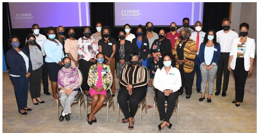
Figure 1 : Les ministères du secteur social se réunissent pour un atelier de renforcement des capacités en matière d'EIP

En avril 2021, le Centre des Caraïbes pour la recherche et le développement des systèmes de santé (CCHSRD), un partenaire du PEERSS à Trinité-et-Tobago, a eu l'occasion d'aider quatre ministères du secteur social (Travail, Développement social et Services aux ménages, Planification et Développement, et Sport et Développement communautaire) à renforcer leurs capacités en matière d'EIP.