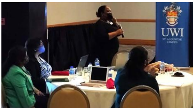
Figure 3 : Des participants du ministère de la Planification et du Développement participent à l'atelier de renforcement des capacités en matière d'EIP

L'atelier de renforcement des capacités, auquel ont participé des décideurs politiques des quatre ministères, a permis de mettre en évidence les points communs entre les travaux des décideurs politiques et leurs différences. Il a également permis d'identifier les lacunes dans la collecte et l'utilisation des données probantes et le potentiel de développement de nouvelles compétences et de nouvelles méthodes de travail. Les séances d'apprentissage en commun organisées tout au long de l'atelier de formation ont contribué à la collecte de ces connaissances.